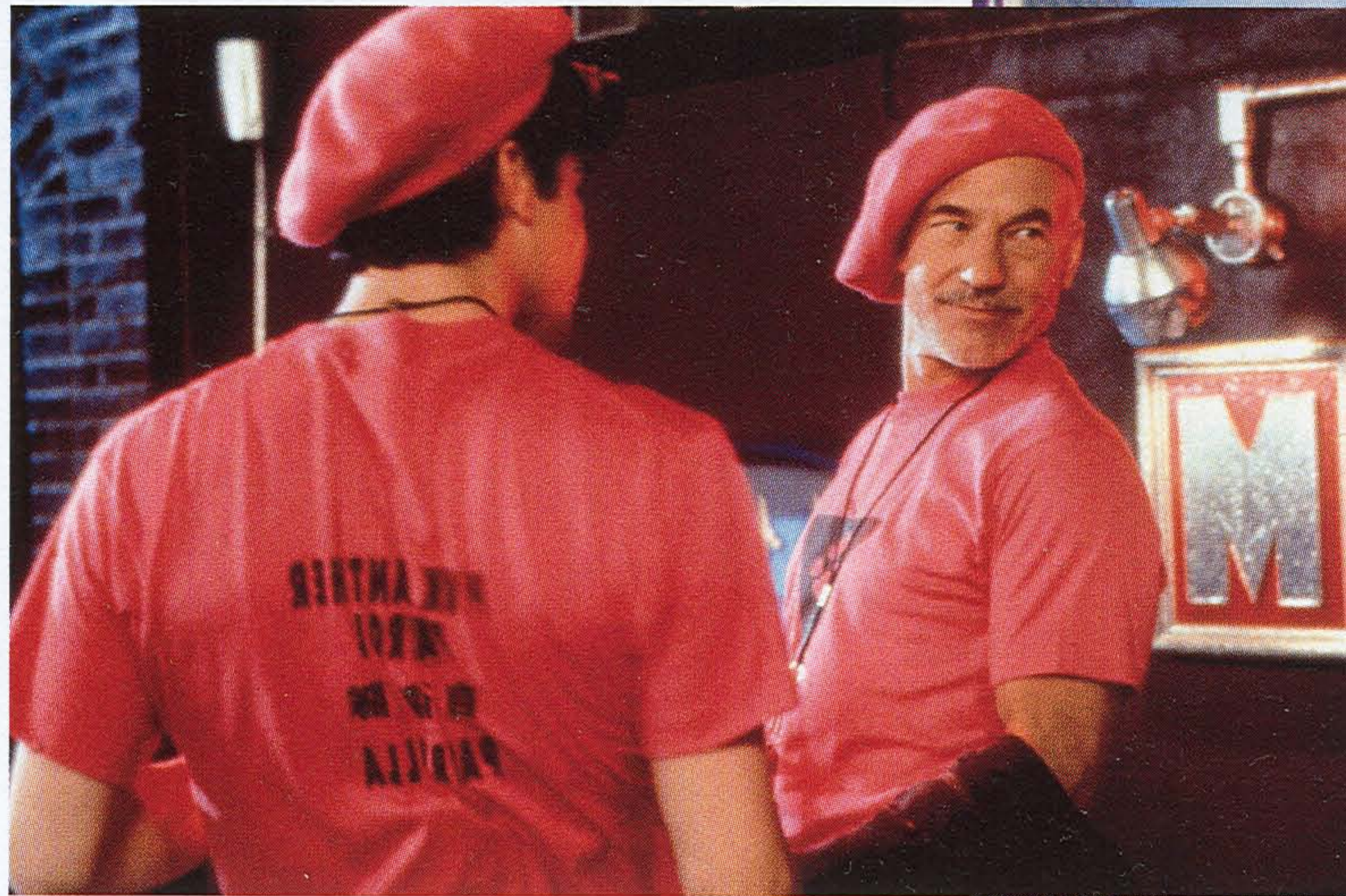
BRYAN BATT & PATRICK STEWART IN „JEFFREY“